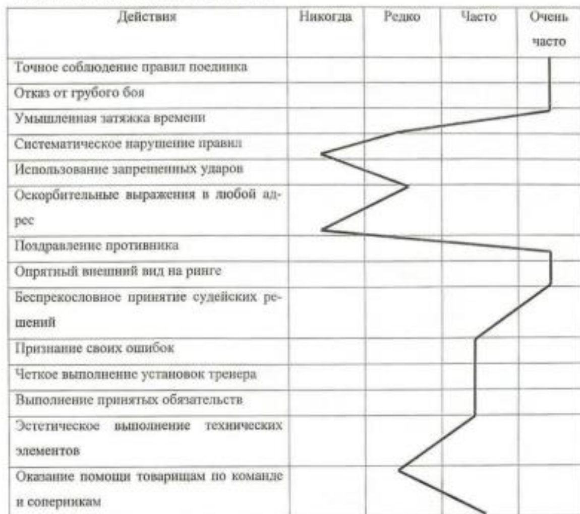
Рис. 1. «Поведенческий портрет» юных боксеров в процессе соревновательной деятельности

Более наглядно негативные и позитивные поступки присущие юным боксерам представлены на рис. 1,2.