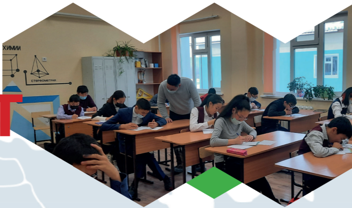
МР «Усть-Алданский улус (район) РС (Я)» 481