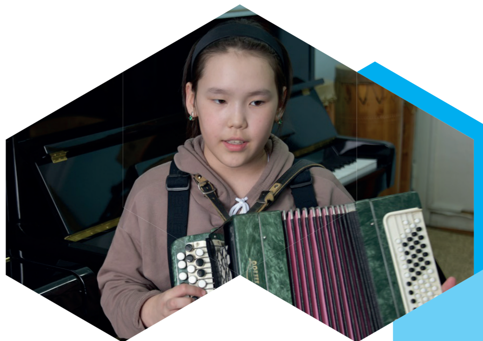
ОБРАЗОВАТЕЛЬНАЯ ЭКСПЕДИЦИЯ В РАМКАХ ВЫЯВЛЕНИЯ И ПОДДЕРЖКИ ОДАРЕННЫХ ДЕТЕЙ В РЕСПУБЛИКЕ САХА (ЯКУТИЯ)