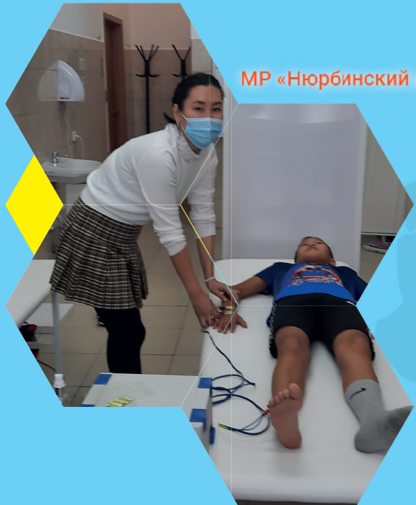
МР «Нюрбинский район» РС (Я) 1 460