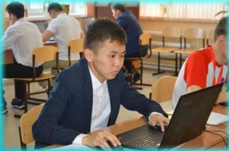
Участник Всероссийского этапа олимпиады в г. Самара