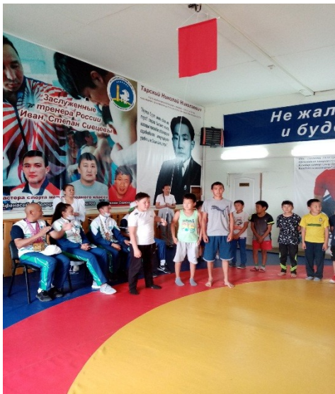
Поднятие Флага лагеря