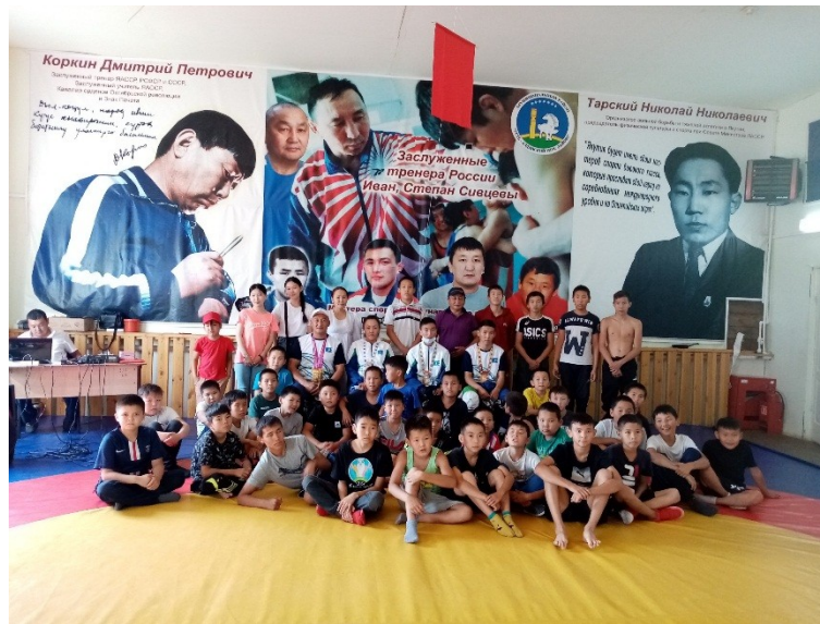
Участники торжественного мероприятия