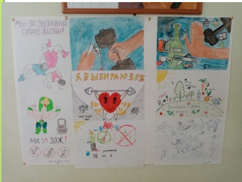
ФОТО конкурс «Мы за здоровый образ жизни»