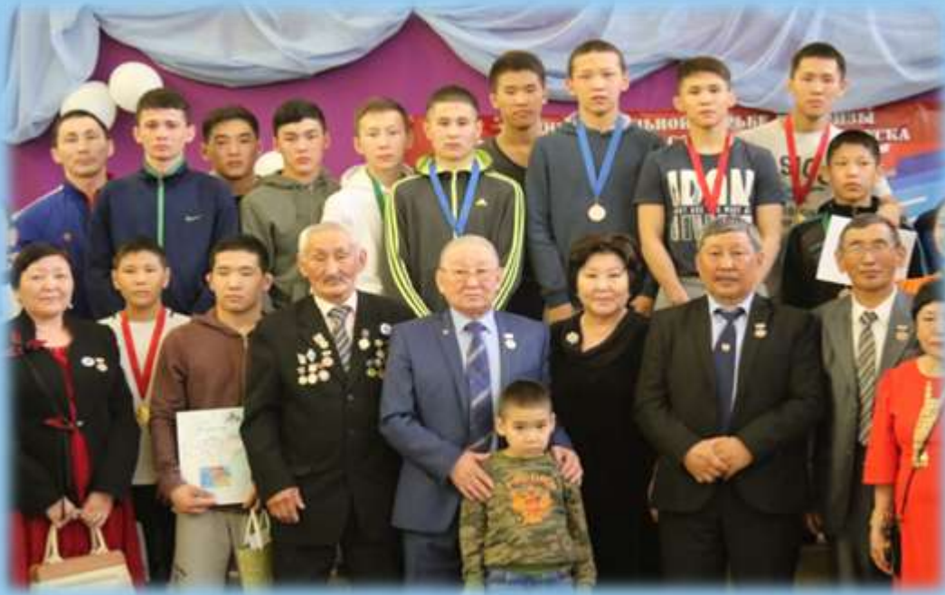
Встреча с выпускниками школы 1969 года