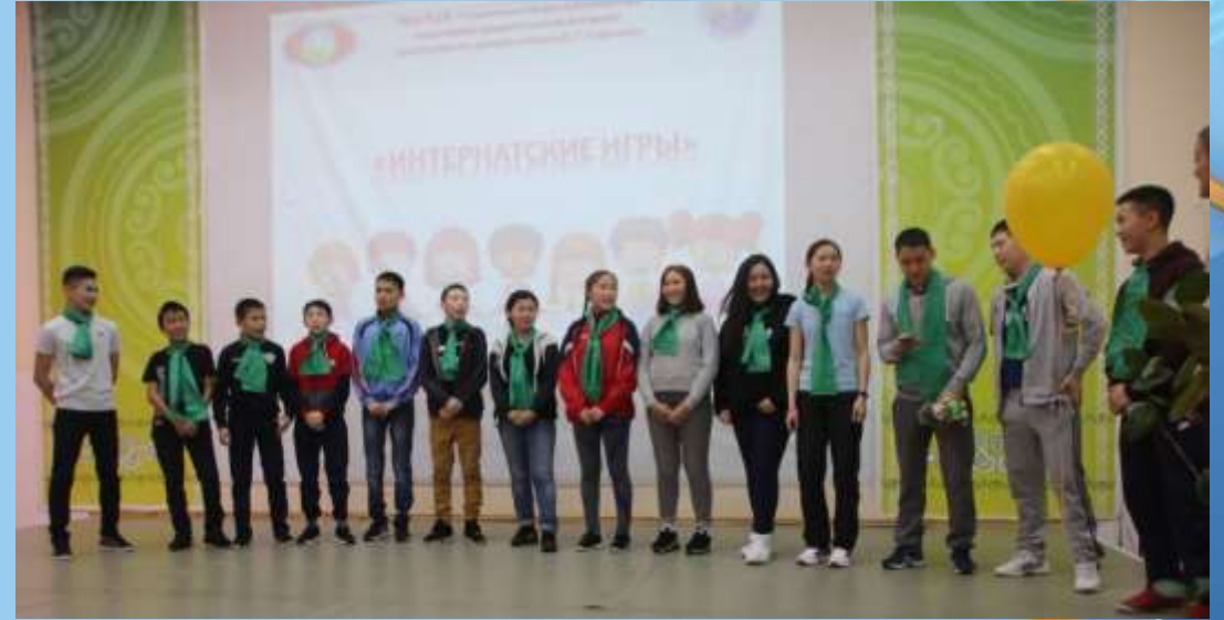
Игра по станциям между командами воспитанников интерната Чурапчинского улуса