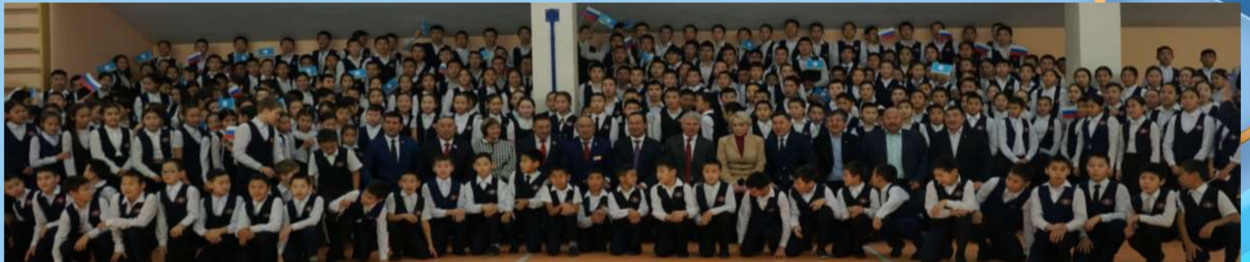
Встреча с главой РС(Я) А.С.Николаевым, министром спорта РФ О.В. Матыциным