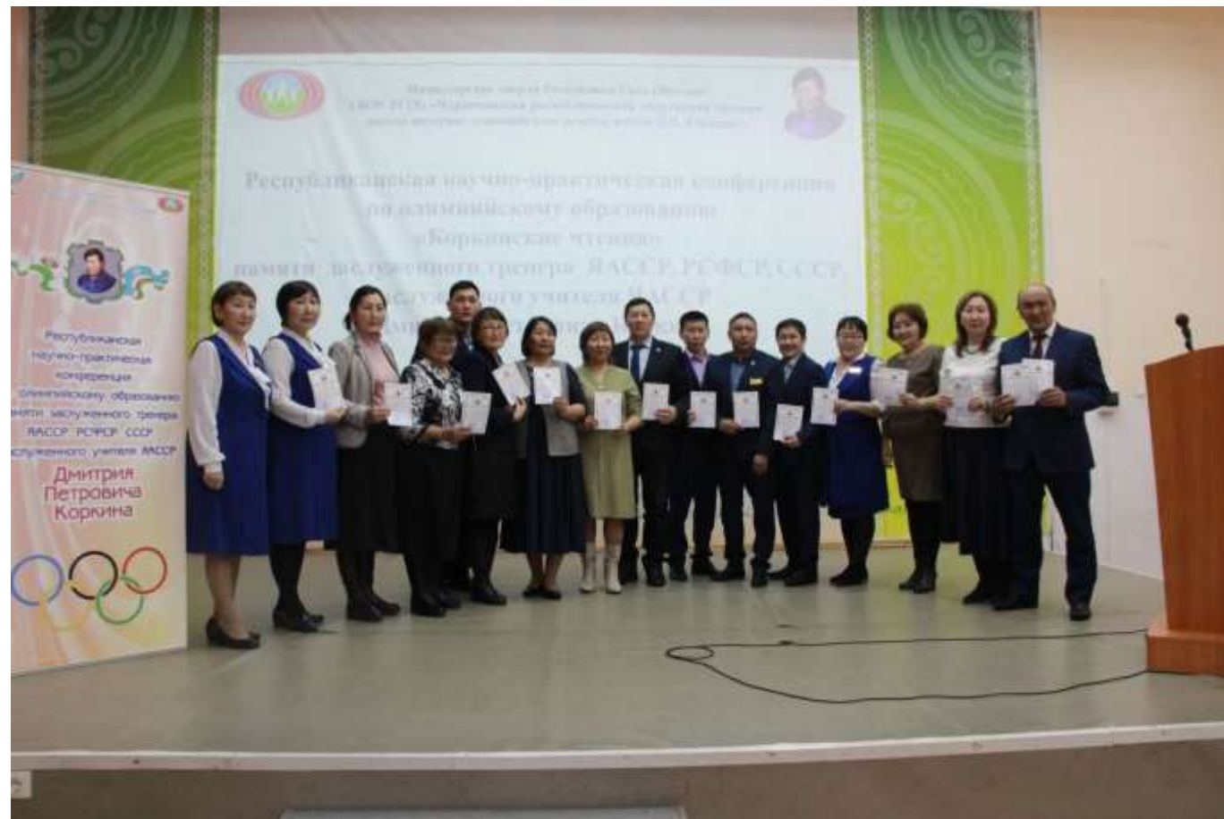
Участие в республиканской научно-практической конференции по олимпийскому образованию «Коркинские чтения» 06 апреля 2018 года