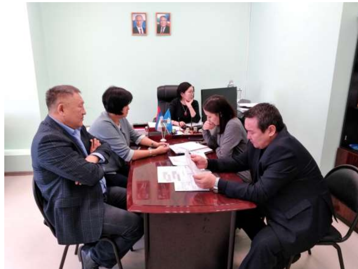
Рабочее совещание о ходе апробации ФЭП 23 февраля 2018 года