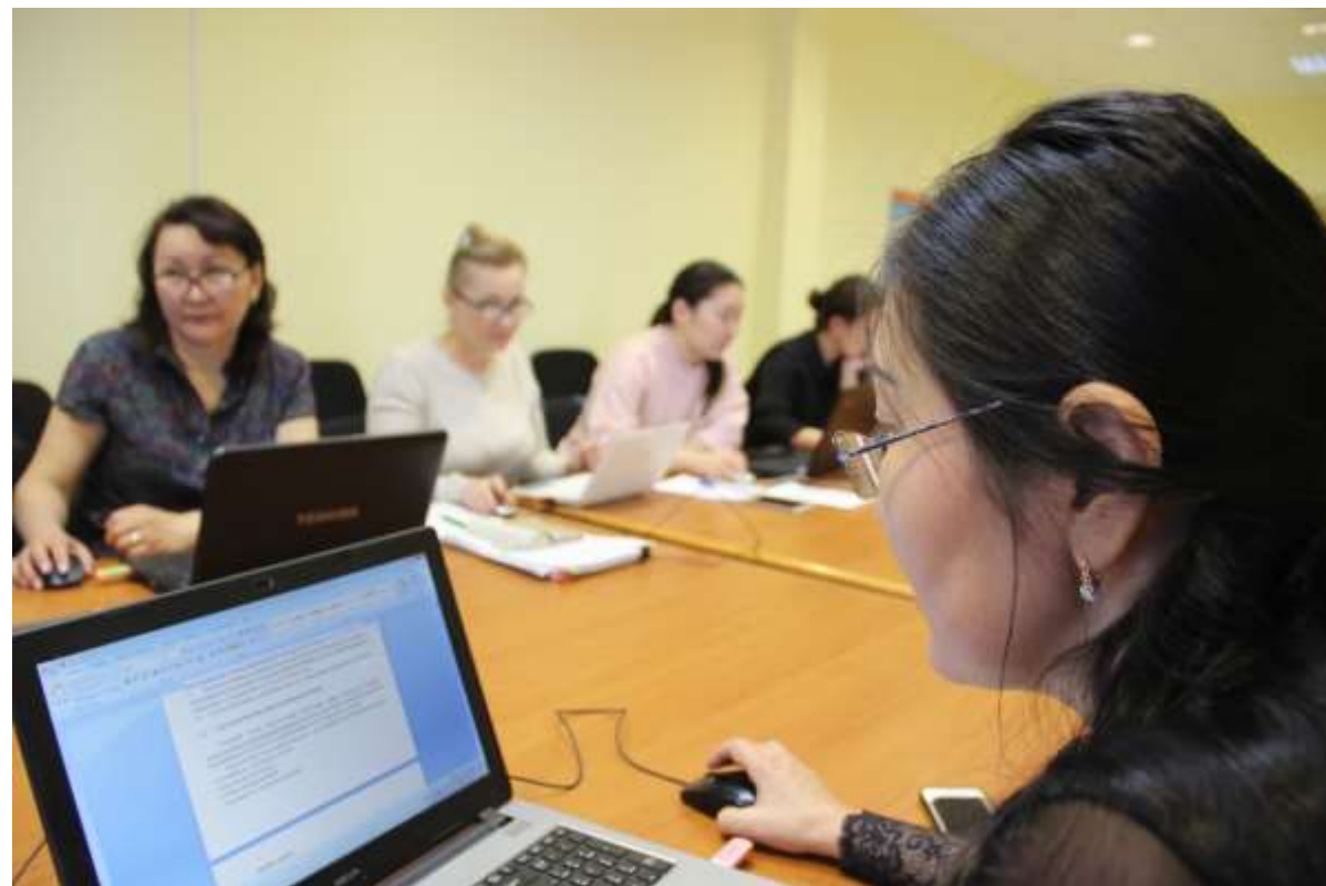
Обучающий семинар «Заполнение первоначальных данных контингента участников и тренерского состава» 13 февраля 2018 года